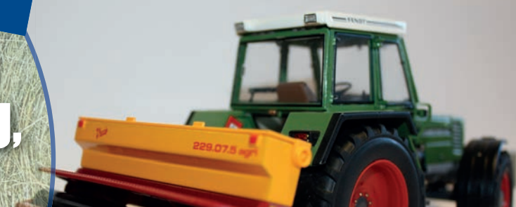
2) Weidepflege- und Nachsaat-Maschinen