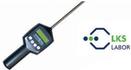
6) Meßtechnik und Futter-Analysen