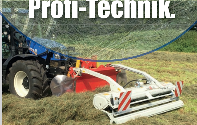
4) Pick-Up- Schwadertechnik