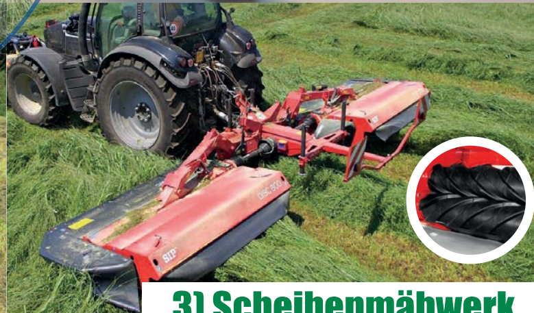
3) Scheibenmähwerk mit Walzenaufbereiter