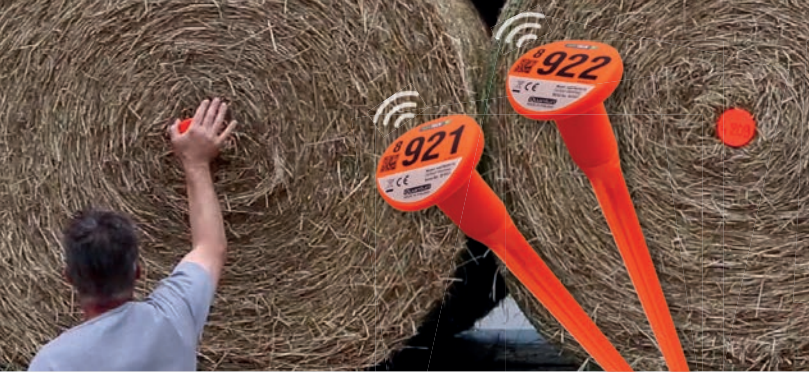
7) Heutemperatur- Überwachungs-System